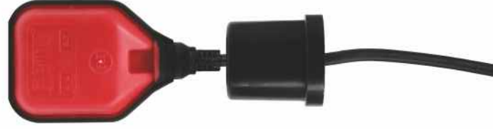
(Temiz Su Seviye Flatörü)

Sıvı seviye flatörleri konutlar ve endüstriyel tesislerdeki durgun sıvı depolarının sıvı seviye kontrolünde kullanılırlar (tanklarda, artezyen kuyularında, lağım çukurlarında, pis sularda). Sıvı seviye şalterimiz % 10 konsantrasyona kadar mineralli ve asitli sulara karşı dayanıma sahiptir. Sıvı seviye şalterlerimizin dış kapağı antişok özellikli polypropylen malzeme ile üretilmiştir ve yüksek ortam sıcaklıklarına dayanıklıdır.