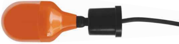
( A : Atık Sıvı Seviye Flatörü 90 ° )

Sıvı seviye flatörleri konutlar ve endüstriyel tesislerdeki durgun sıvı depolarının sıvı seviye kontrolünde kullanılırlar (tanklarda, artezyen kuyularında, lağım çukurlarında, pis sularda). Sıvı seviye şalterimiz % 10 konsantrasyona kadar mineralli ve asitli sulara karşı dayanıma sahiptir. Sıvı seviye şalterlerimizin dış kapağı antişok özellikli polypropylen malzeme ile üretilmiştir ve yüksek ortam sıcaklıklarına dayanıklıdır.